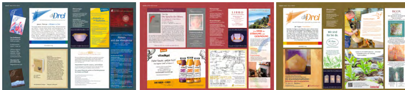
Beispiele unserer Inserateseiten

Gemeinnützige Institutionen (Steinerschulen, heilpädagogische Einrichtungen...) erhalten für Stelleninserate ab dem zweiten Inserat einen Rabatt über 30 %.