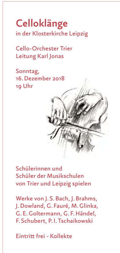
Veranstaltung, Format 3